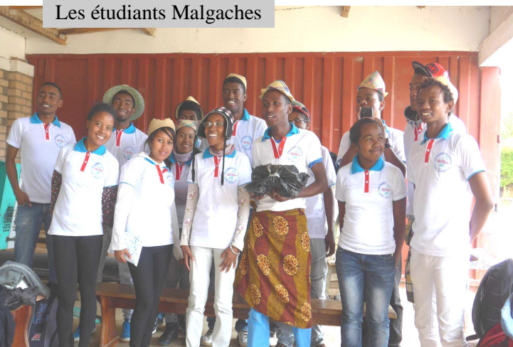
Les étudiants Malgaches