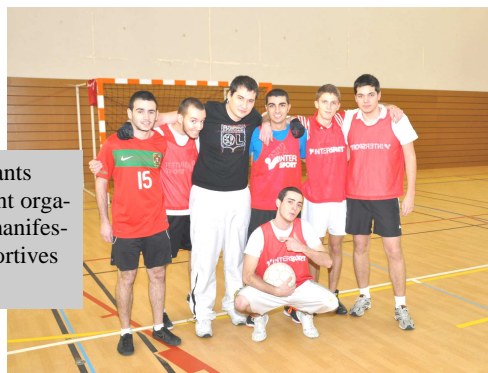
Des étudiants français ont organisé des manifestations sportives

Sélectionner les demandes des étudiants malgaches