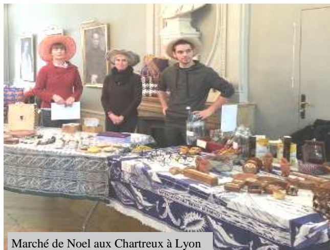
Marché de Noël aux Chartreux à Lyon

Sélectionner les demandes des étudiants malgaches